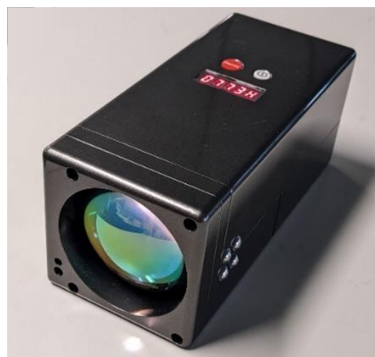
遠隔 R32 検知器の試作機